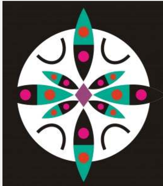
Aquí sobre la Tierra

Hora: 17:00 horas. Lugar: Aula Magna del Centro Cultural José Atanasio Monroy